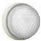
Twister tonda 240